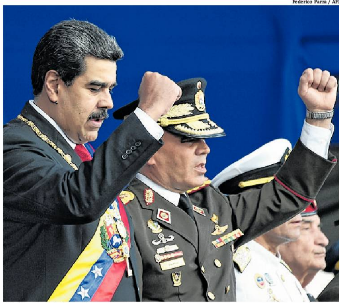
Maduro e ministro da Defesa, Vladimir Padrino, fazem mesmo gesto na posse

A Força Armada da Venezuela jurou ontem "lealdade e subordinação absoluta" ao presidente Nicolás Maduro, ao reconhecer seu segundo período de governo em uma parada militar em Caracas. "Juramos reafirmar a lealdade e subordinação absoluta", perguntou o ministro da Defesa, general Vladimir Padrino, a 4.900 oficiais, soldados e cadetes que compareceram ao ato na Academia Militar, onde renderam honras a Maduro após sua posse. "Juramos", responderam com suas armas nas mãos. O presidente Nicolás Maduro tomou posse ontem para um segundo mandato de seis anos, considerado ilegítimo por vários países da comunidade internacional e com uma Venezuela em ruínas e cada vez mais isolada. "Juro em nome do povo da Venezuela (...) juro pela minha vida", declarou Maduro, que recebeu a faixa presidencial do presidente da Suprema Corte de Justiça (governista), em um ato que não foi assistido por nenhum representante da União Europeia (UE) ou a maioria dos países das Américas. Coincidindo com a posse, duas horas depois, a Organização dos Estados Americanos (OEA) aprovou uma resolução para declarar ilegítimo o segundo mandato de Maduro. A resolução, aprovada por 19 votos a favor, seis contra, oito abstenções e